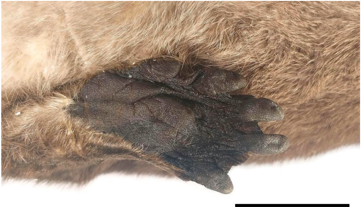
Figura 2. Vista plantar de la pata izquierda de un macho adulto de Lontra longicaudis (MZUA-MA424) registrado en Saucay, provincia del Azuay, Ecuador. Escala=5 cm.