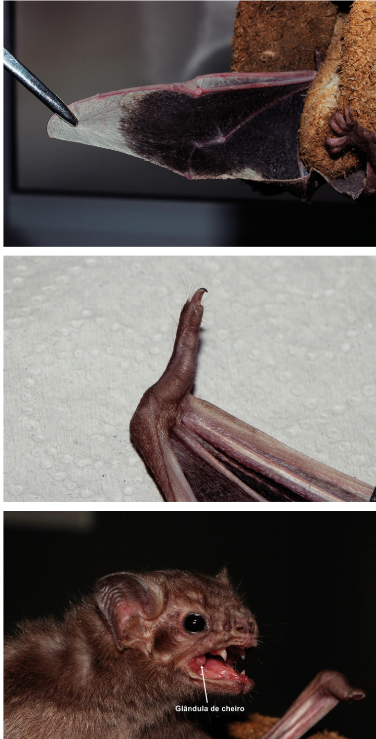
Figura 1. Caracteres morfológicos identificados nos indivíduos de D. youngi coletados. A - Asa com ponta branca; B - Polegar com uma almofada; C - Rosto com orelhas curtas e arredondadas e glândula de cheiro proeminente no interior das bochechas.