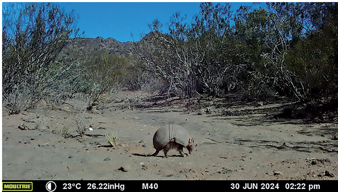
Figura 1. Registro fotográfico del mataco ( Tolypeutes matacus ) tomado con trampas cámara en el departamento de Valle Fértil, San Juan, República Argentina. Figure 1. Photographic record of the Southern three-banded armadillo ( Tolypeutes matacus ) taken by a camera trap in the Valle Fértil department, San Juan, Argentina.